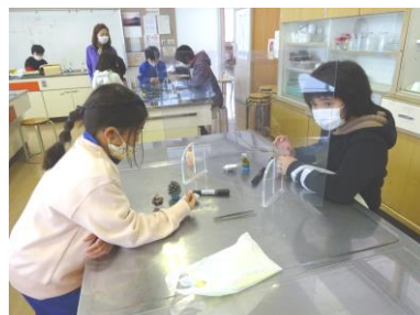
オリジナルキャンドルを作ろう