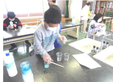
あら不思議 スライムができたあ