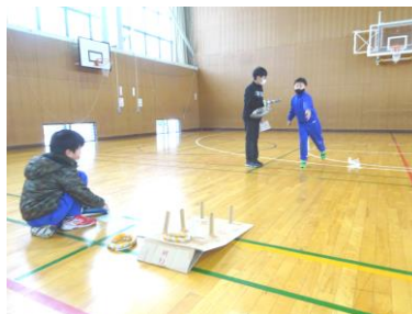
輪投げで何点入るかな