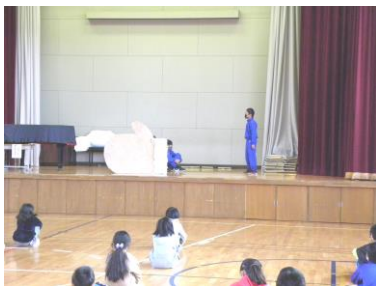
新聞図書委員会の発表「てぶくろ」