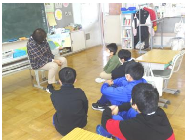
読み聞かせにワクワク、ドキドキ