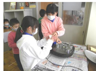
どんな松ぼっくりツリーにしようかな